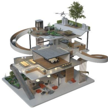
Bild 3: Ein weiteres Highlight des Exponates ist der dreidimensionale Rundgang durch ein futuristisches Gebäude, in welchem Mitsubishi Electric-Komponenten demonstriert werden.